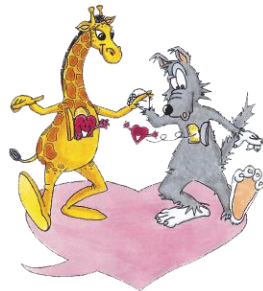
(illustriert von Serena Rust)

Die Symboltiere Wolf- und Giraffe bilden die Differenzierung der unterschiedlichen Kommunikationsweisen ab.